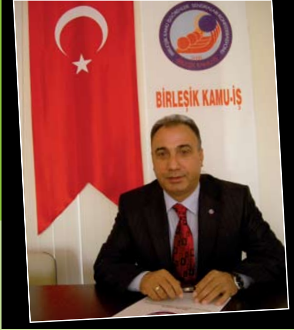
Hasan KÜTÜK Birleşik Kamu-İş Genel Başkanı