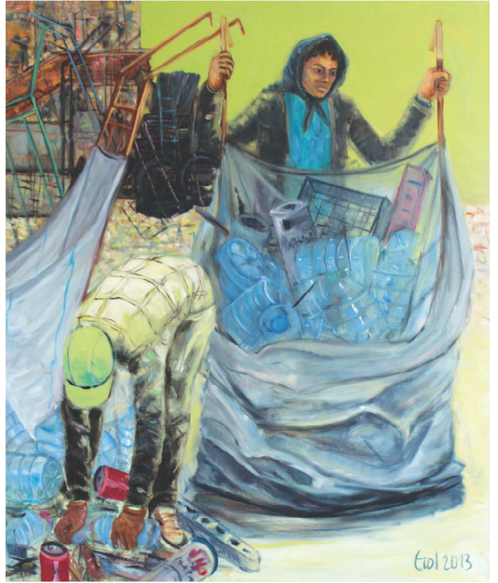
Çöp Toplayanlar, 120 X 100 cm

Çağını izler, çağını gözler ve çağını belgeler sanatçı. İşleri kendinden büyük olur, kendinden çok görünür olur. Erol Batırbek yıllarca yoğun emekle, duyarlılığı, duruşla, sanattan yana saf tutuşla bir götürür. İnsan yüzündeki çizgilere benzer çizgileri, yaşanmış, birikmiş ve ustaca.