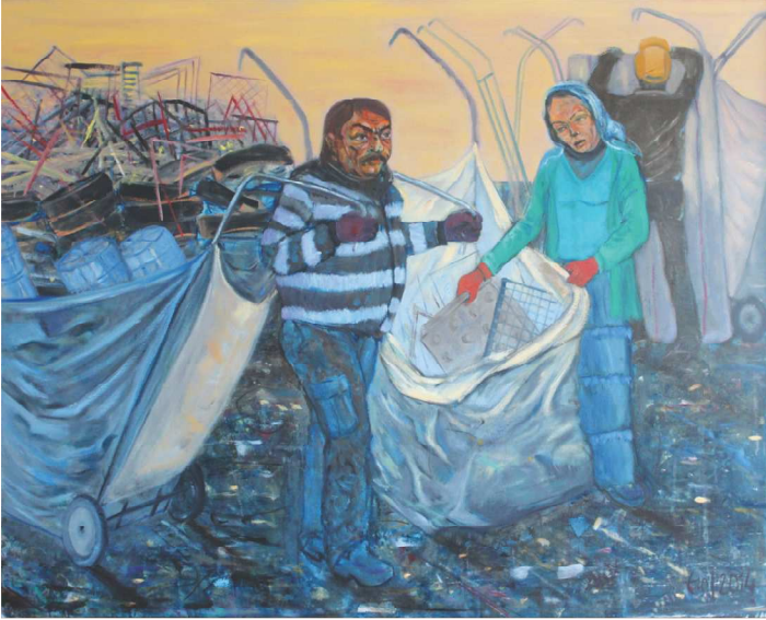
Çöp Toplayanlar, 130 X 162 cm