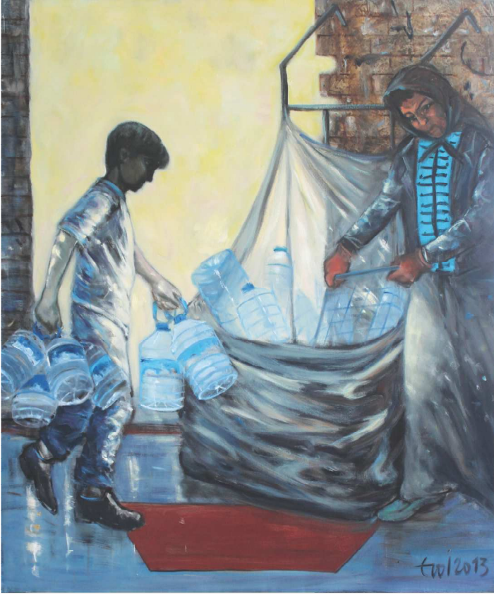
Çöp Toplayanlar, 120 X 100 cm