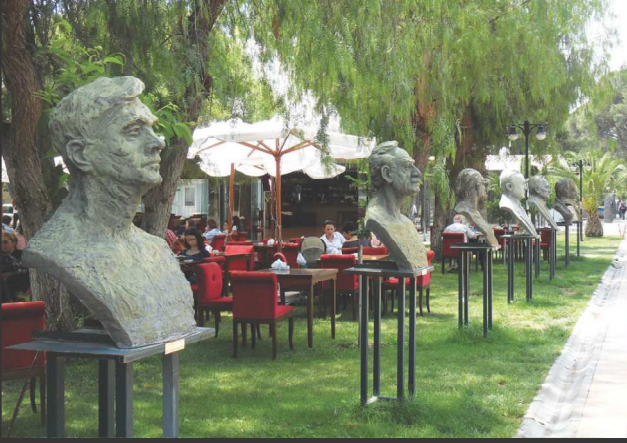
Büstlerin yerleştirildikleri alan