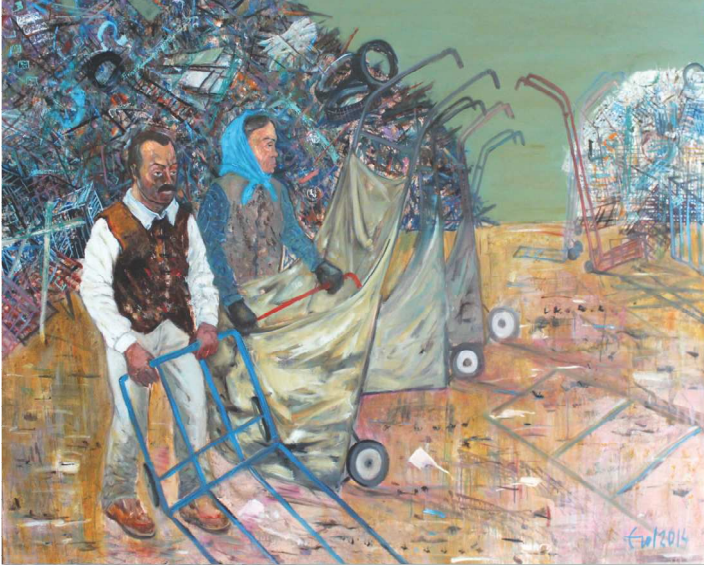
Çöp Toplayanlar, 130 X 162 cm