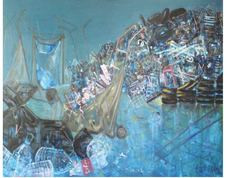
Çöp Toplayanlar, 130 X 162 cm

Resimlerimde konularımı genellikle tanıklığı ettiğim olaylardan ve çevremden alıyorum. Balerinler, atlar, hayat kadınları, nü'ler, portreler ve son yıllarda çöp toplayanlar gibi..