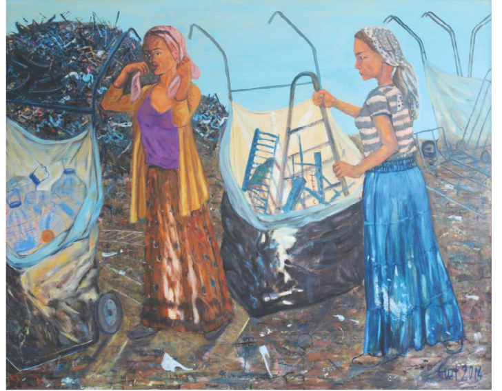
Çöp Toplayanlar, 130 X 162 cm