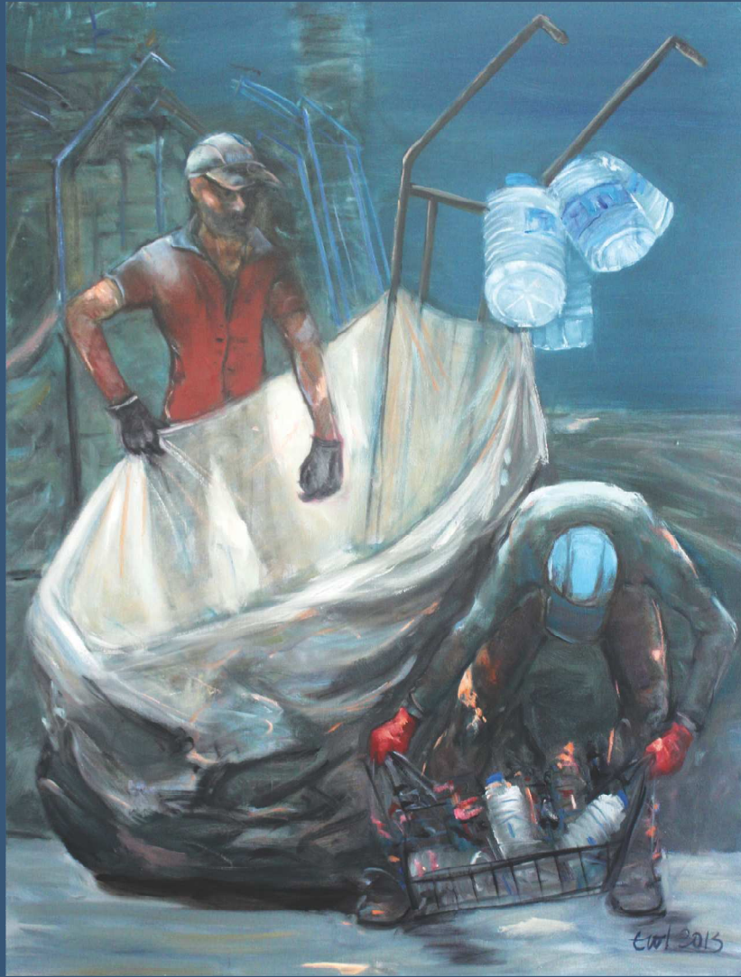
Erol Batırbek, 'Çöp Toplayanlar' (120X100 cm)