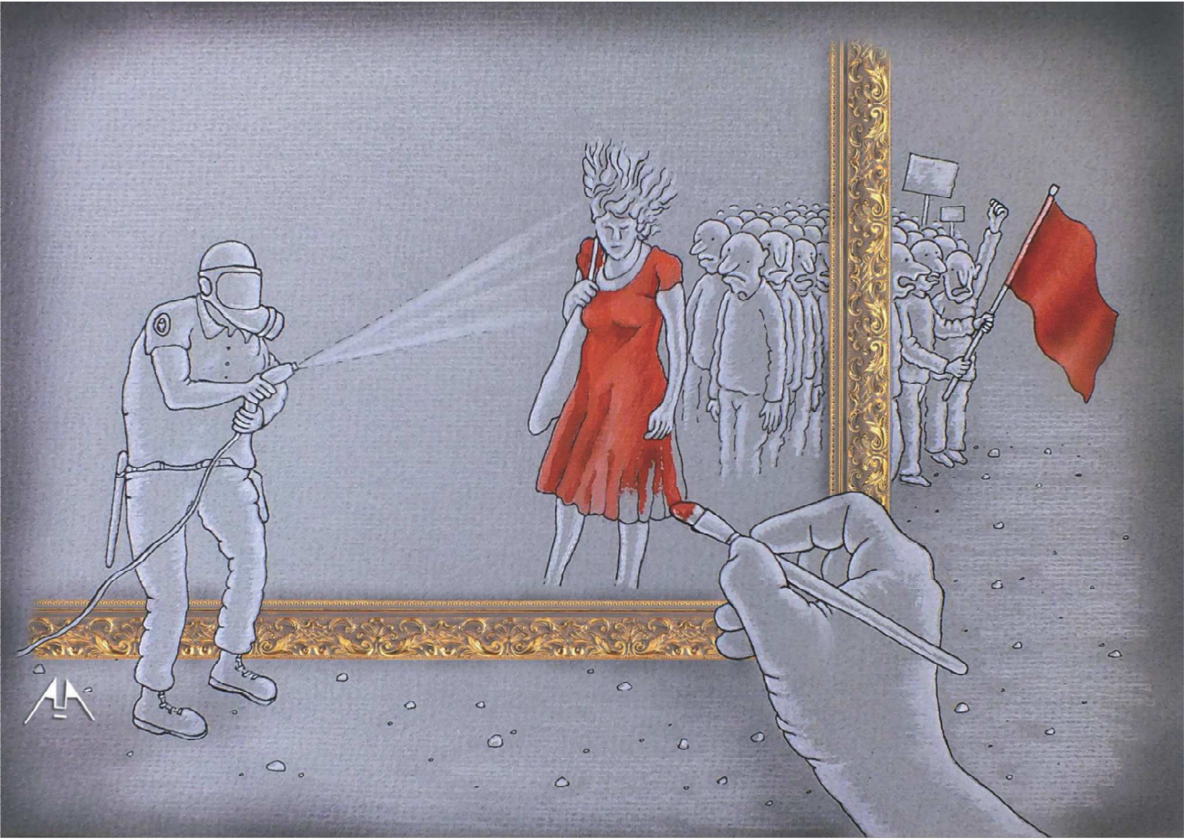
Adnan Yücel 3. Edebiyat ve Sanat Festivali kapsamında düzenlenen "Gezi-Sokak-Sanat" konulu Karikatür Yarışması "SANAT ÖDÜLÜ"