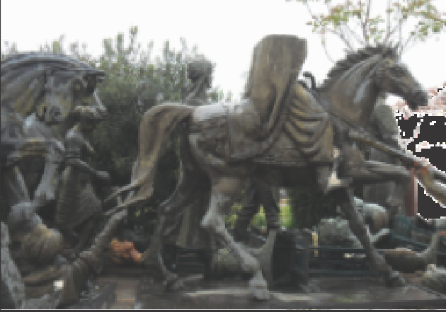
Heykeller yerleştirilmeden önce