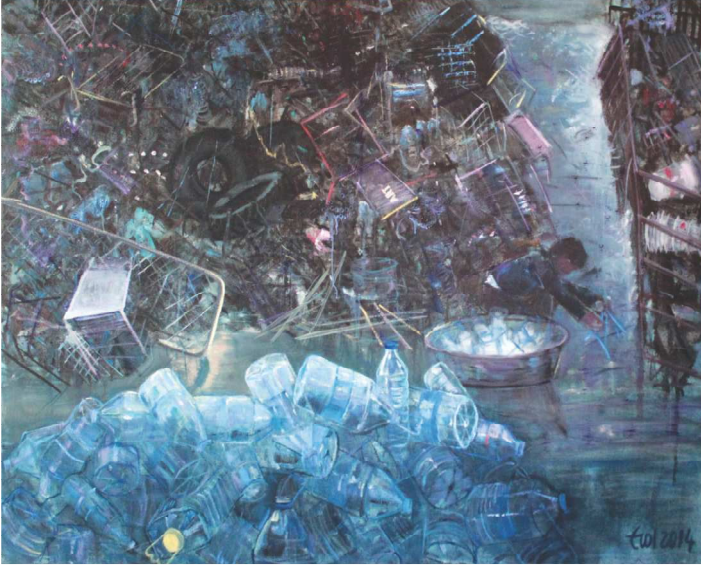
Çöp Toplayanlar, 130 X 162 cm