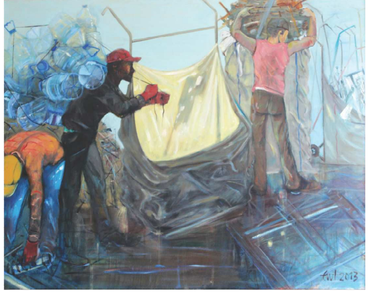
Çöp Toplayanlar, 130 X 162 cm

Ben gözlemciyim ve temaların ressamıyım. Ele aldığım konuyu etraflıca araştırırım. Ulaşabildiğim tüm yazınsal, görsel ve işitsel kaynaklardan yararlanmaya çalışırım. Onlarca eskiz sonrasında tualin karşısına geçerim.