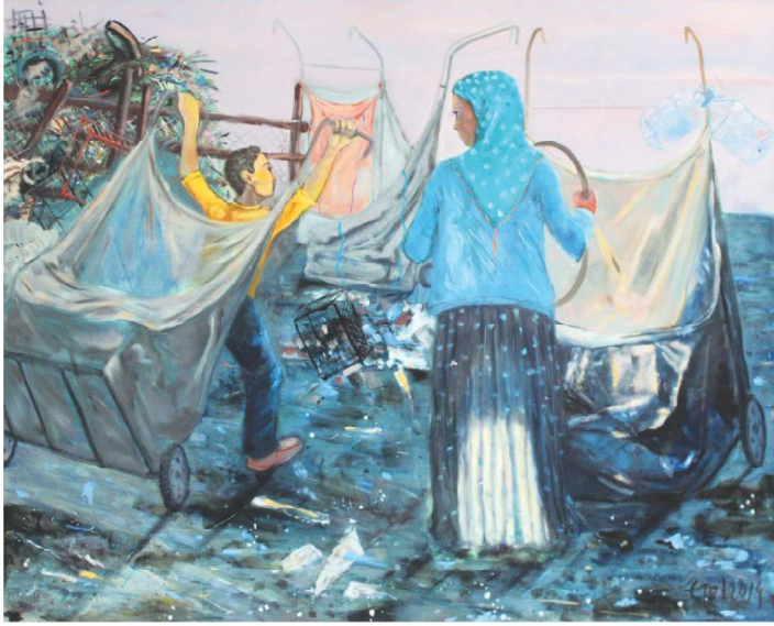
Çöp Toplayanlar, 130 X 162 cm