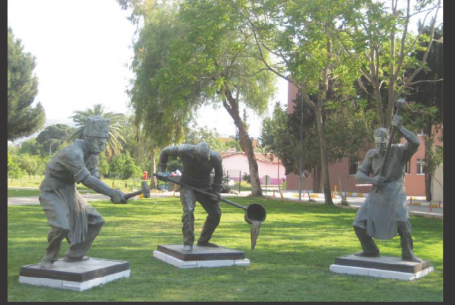
Metin Yurdanur, Demir Dövenler, 2000, Polyester