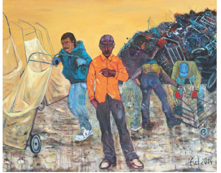
Çöp Toplayanlar, 130 X 162 cm

Eskiden 'sanat nedir' tartışmaları yapılırken şimdilerde 'sanat ne değildir' tartışması yapılmaktadır. Sanatta yaratıcılığın yerine ilginçlik ve gündem oluşturma amaçlanmıştır. Sanatçının bir duruşu ve söyleyecek bir lafı olmalıdır. Bireysel özgünlüğü ve özgürlüğü olmayan kişi sanatçı olamaz ve işleri de anonim olmaktan öteye geçemez.