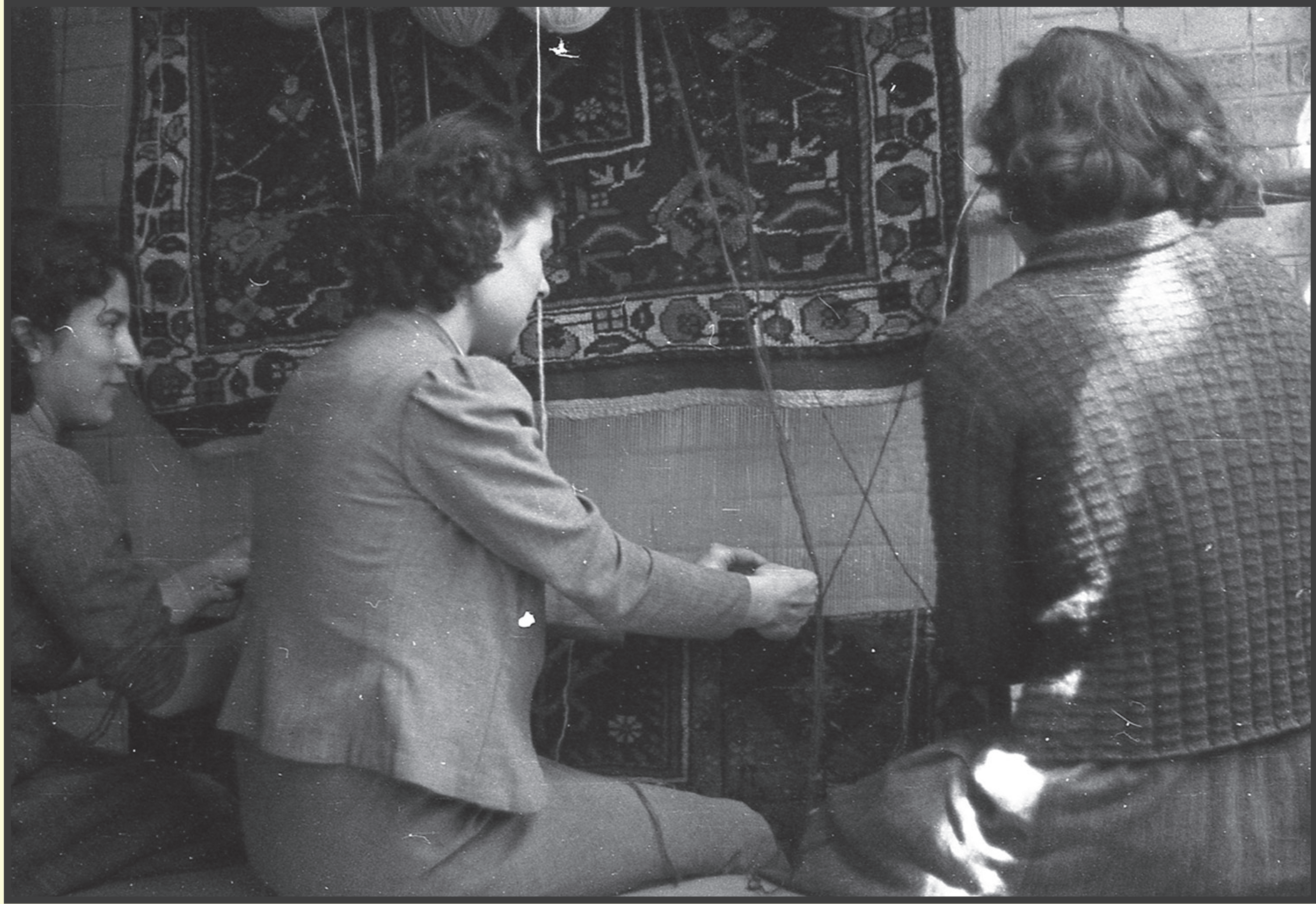
bir devir / bir devrim

Kızılçullu Köy Enstitüsünde öğrencileri dokumacılık işliğinde uygulamalı halı dokuma dersinde...