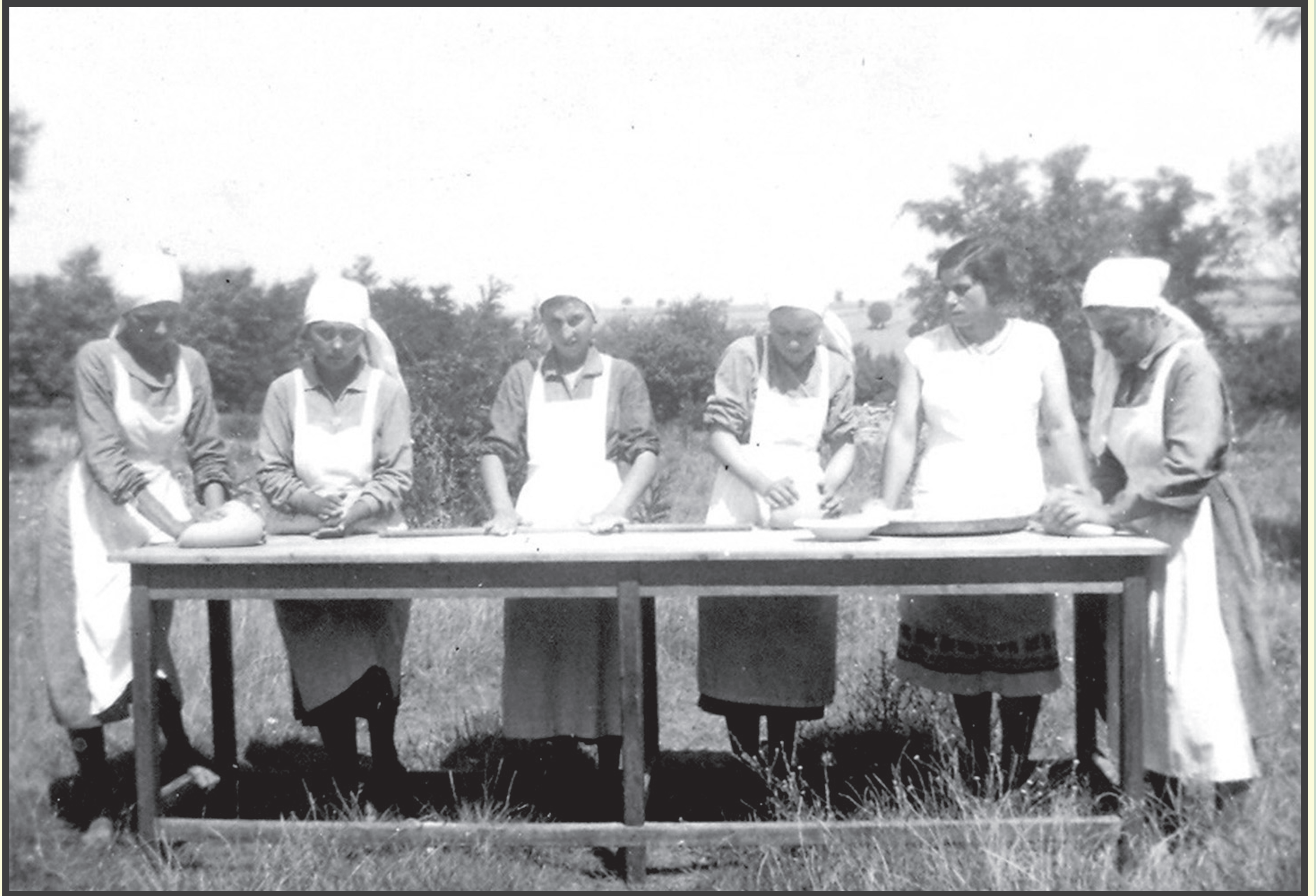
bir devir / bir devrim