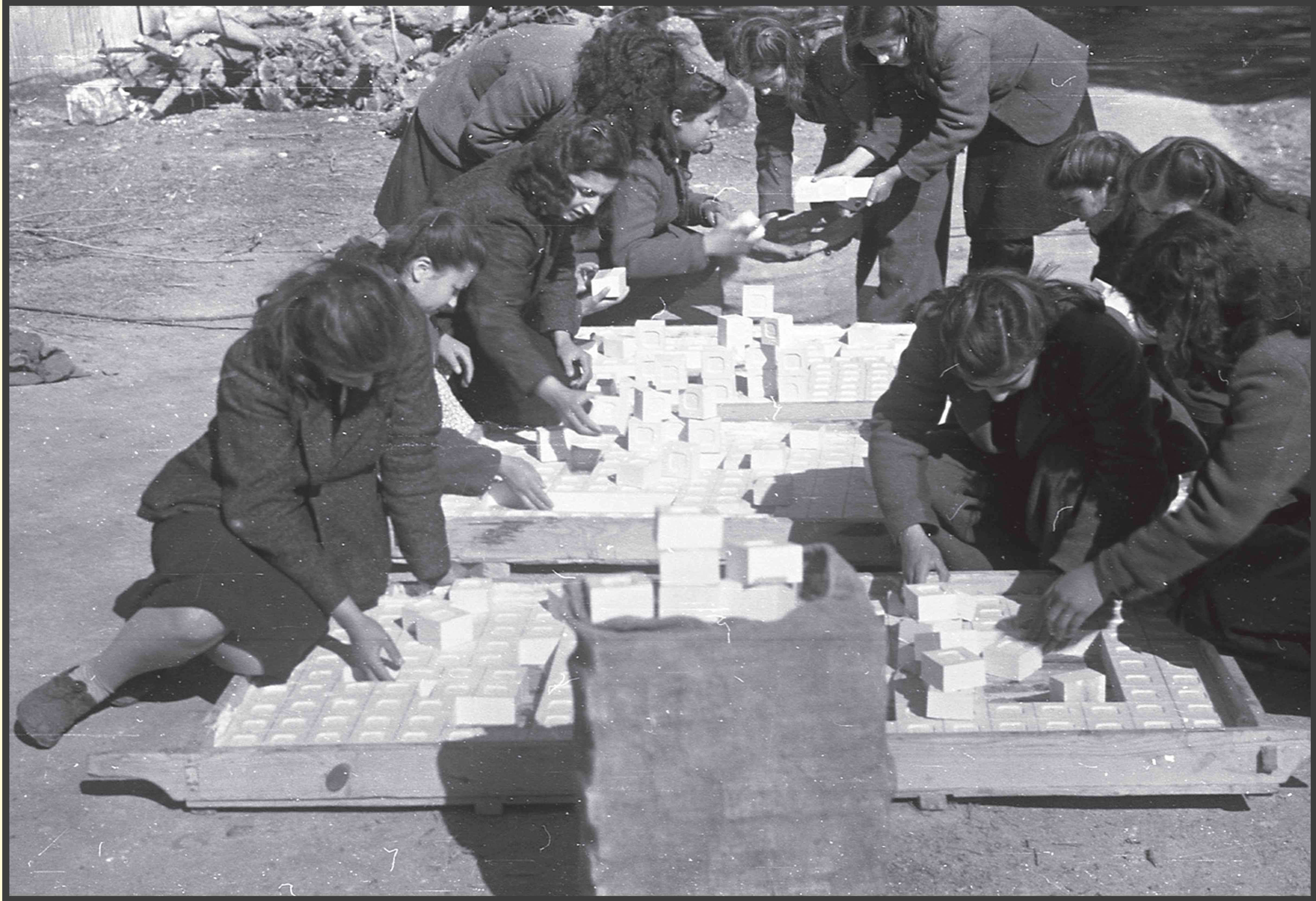
bir devir / bir devrim

Kızılçullu Köy Enstitüsünde zeytinyağından sabun üreten kız öğrenciler...