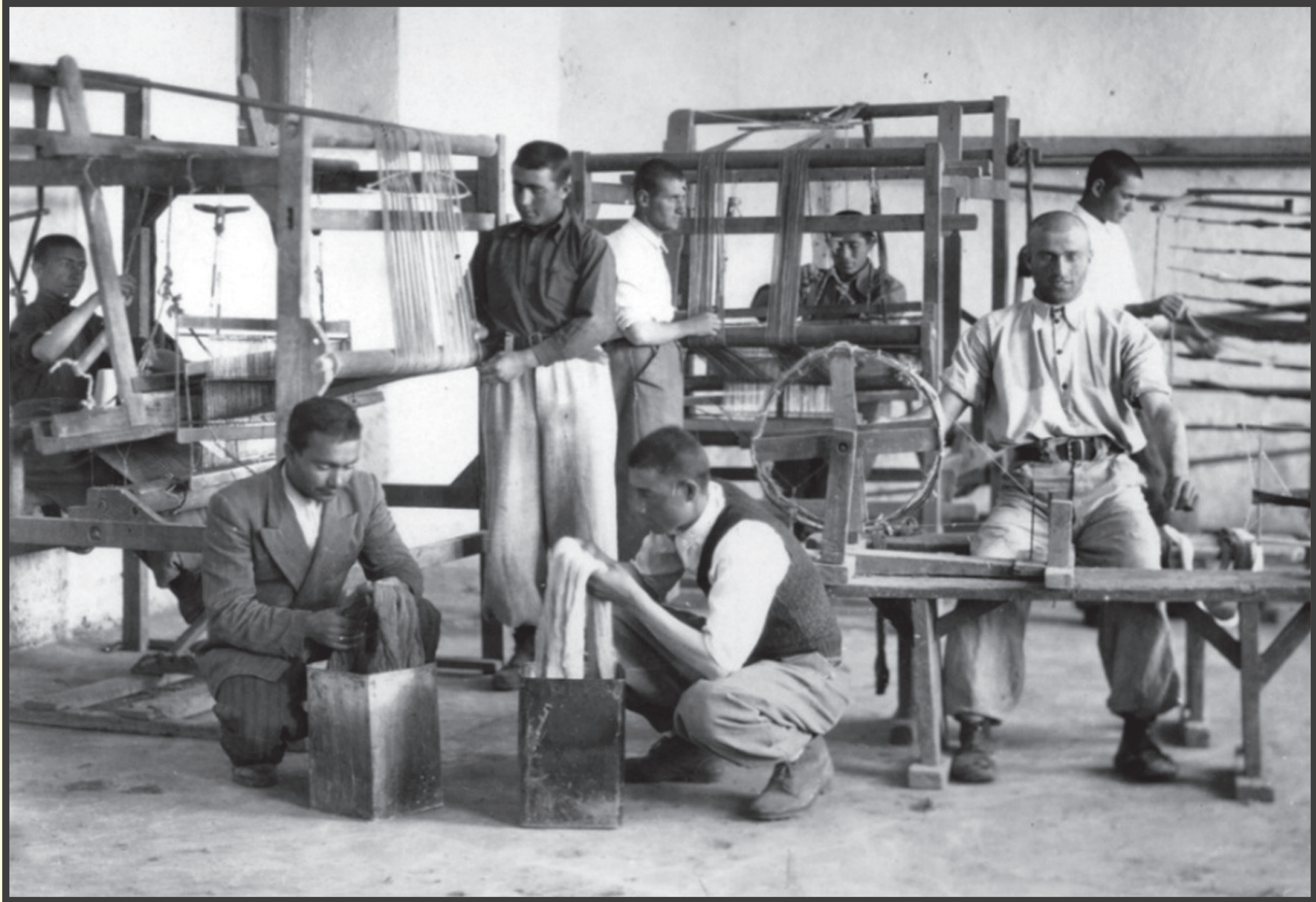
bir devir / bir devrim