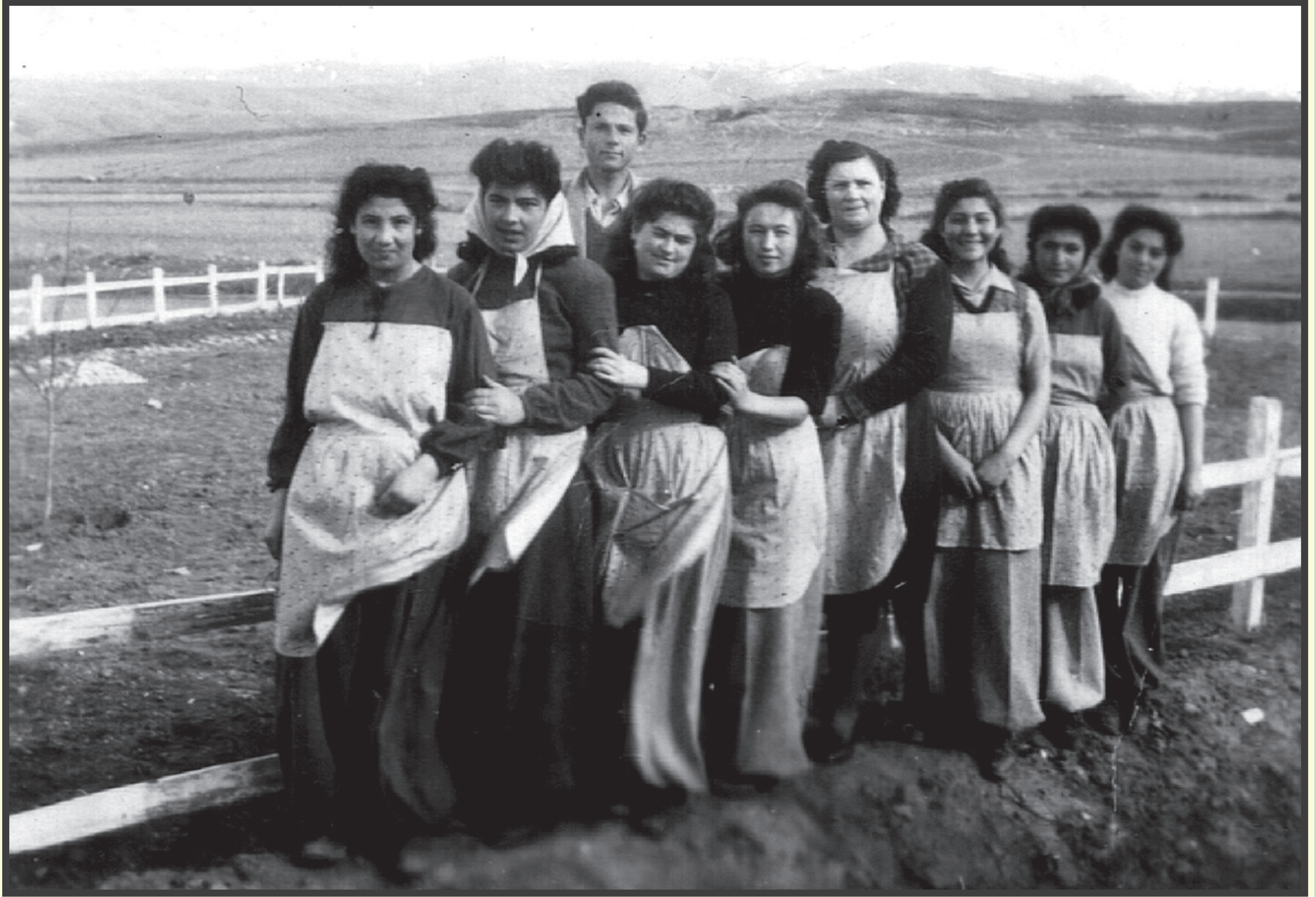
bir devir / bir devrim

Hasanoğlan Köy Enstitüsü Yüksek Kısım kız öğrencileri...