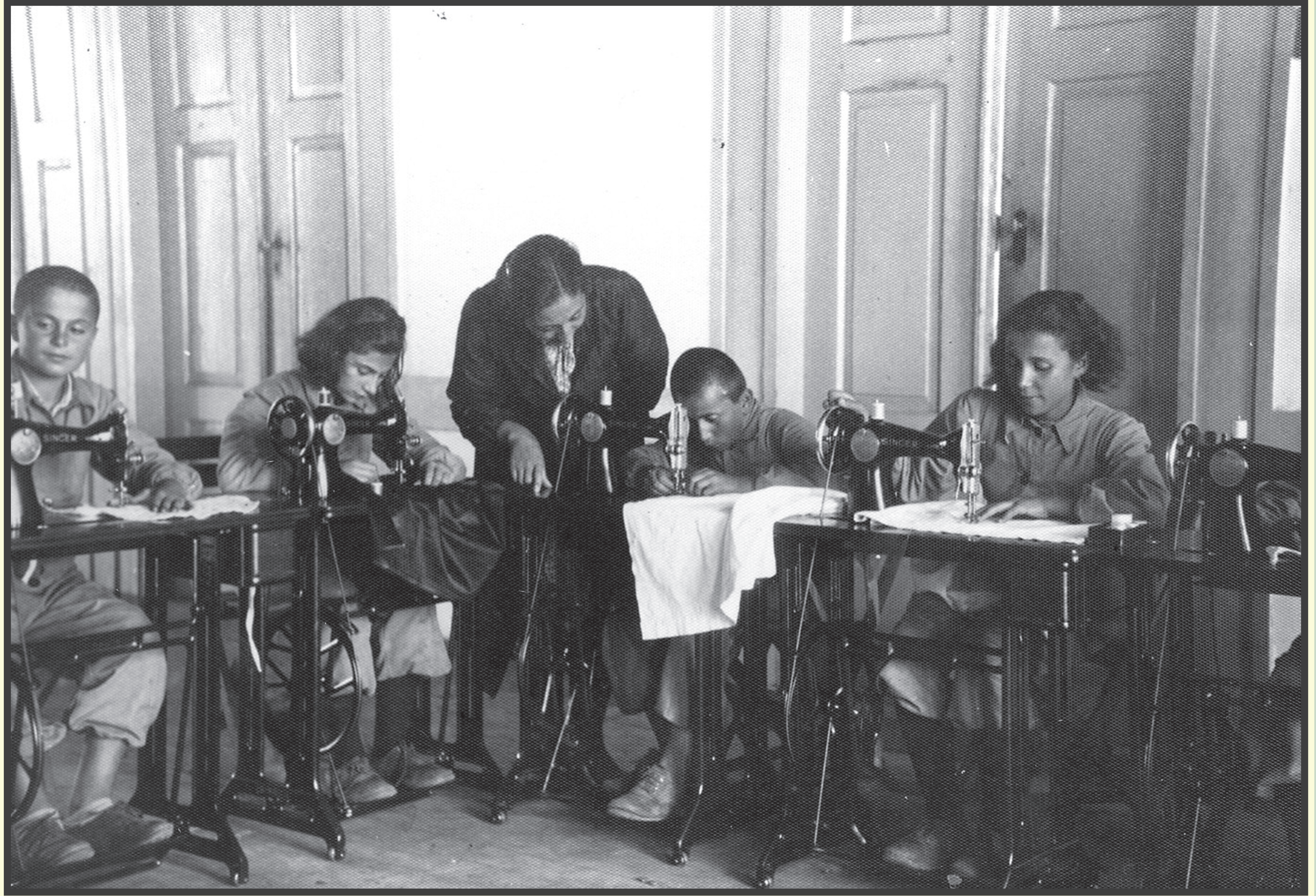
bir devir / bir devrim