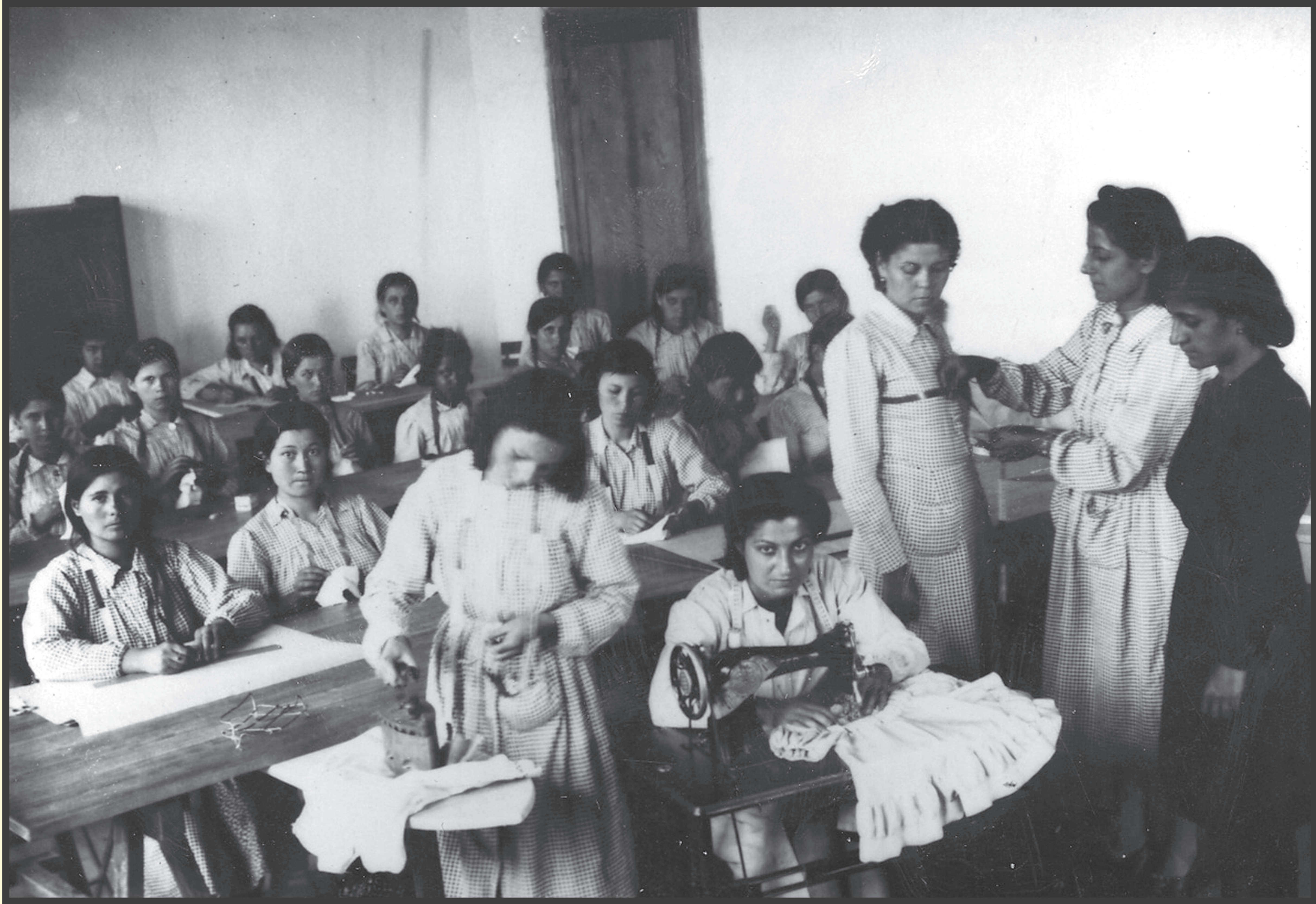
bir devir / bir devrim