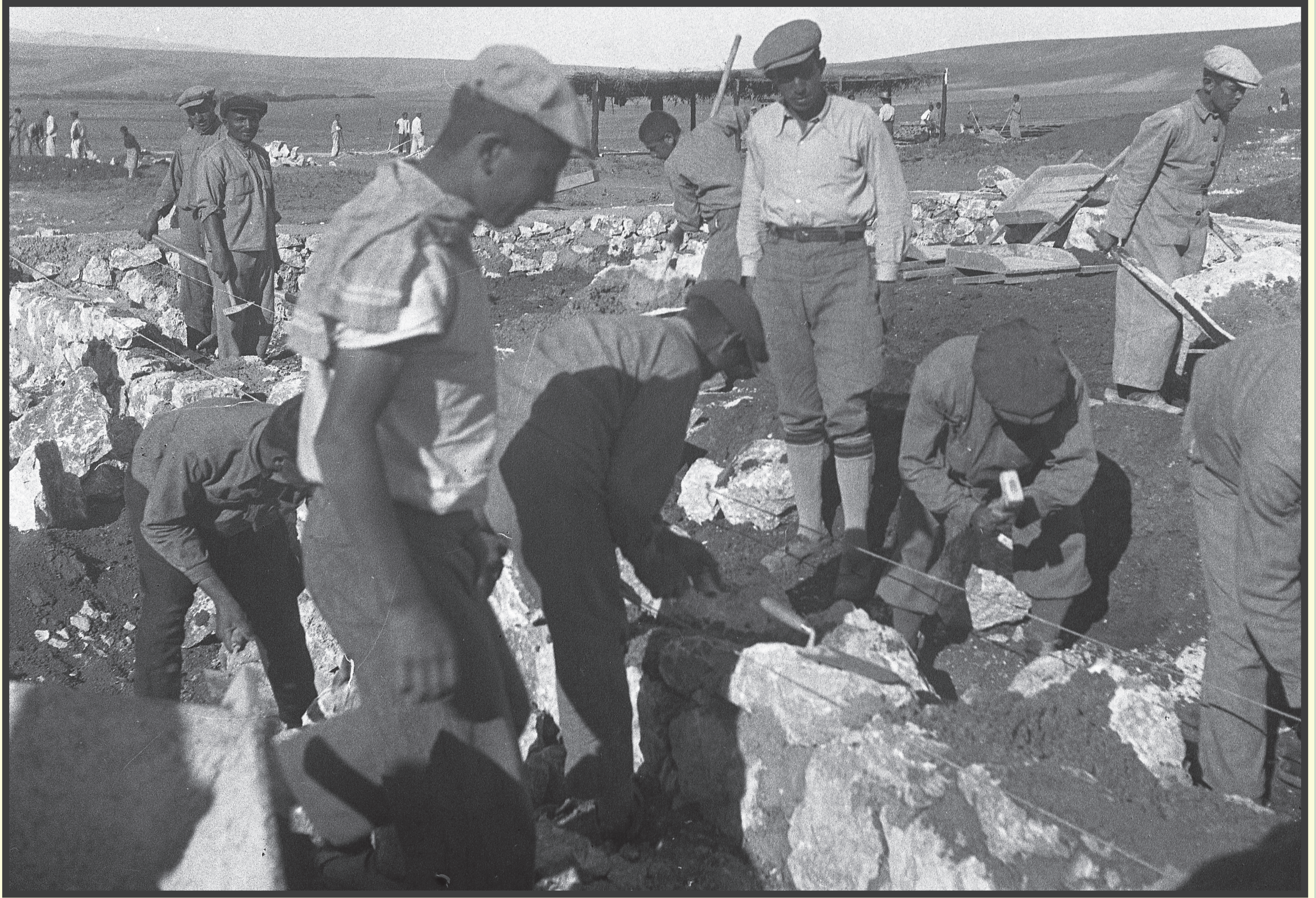
bir devir / bir devrim

Köy Enstitüsü öğrencileri yapıcılık dersinde duvar örerken...