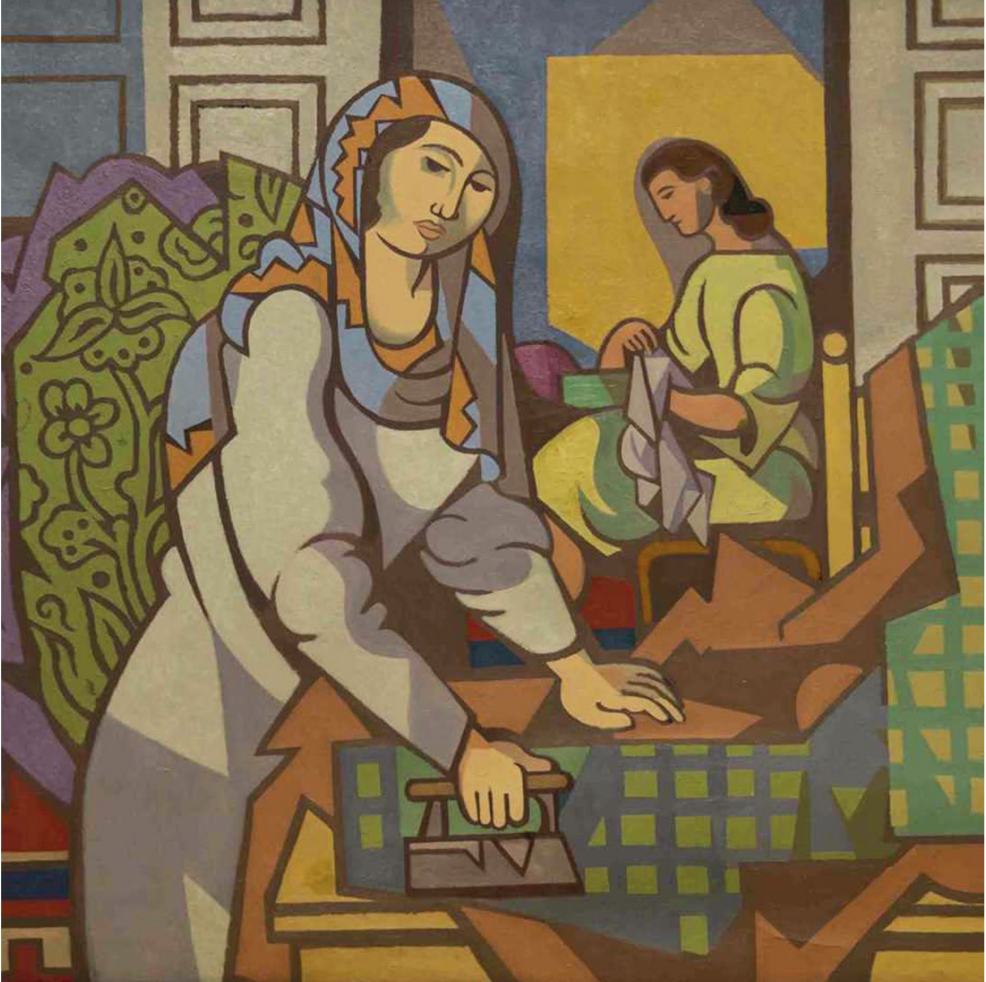
Resim: Nurullah BERK