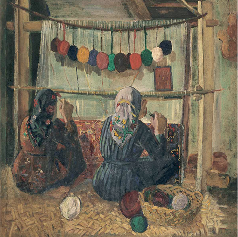
Resim: Malik AKSEL