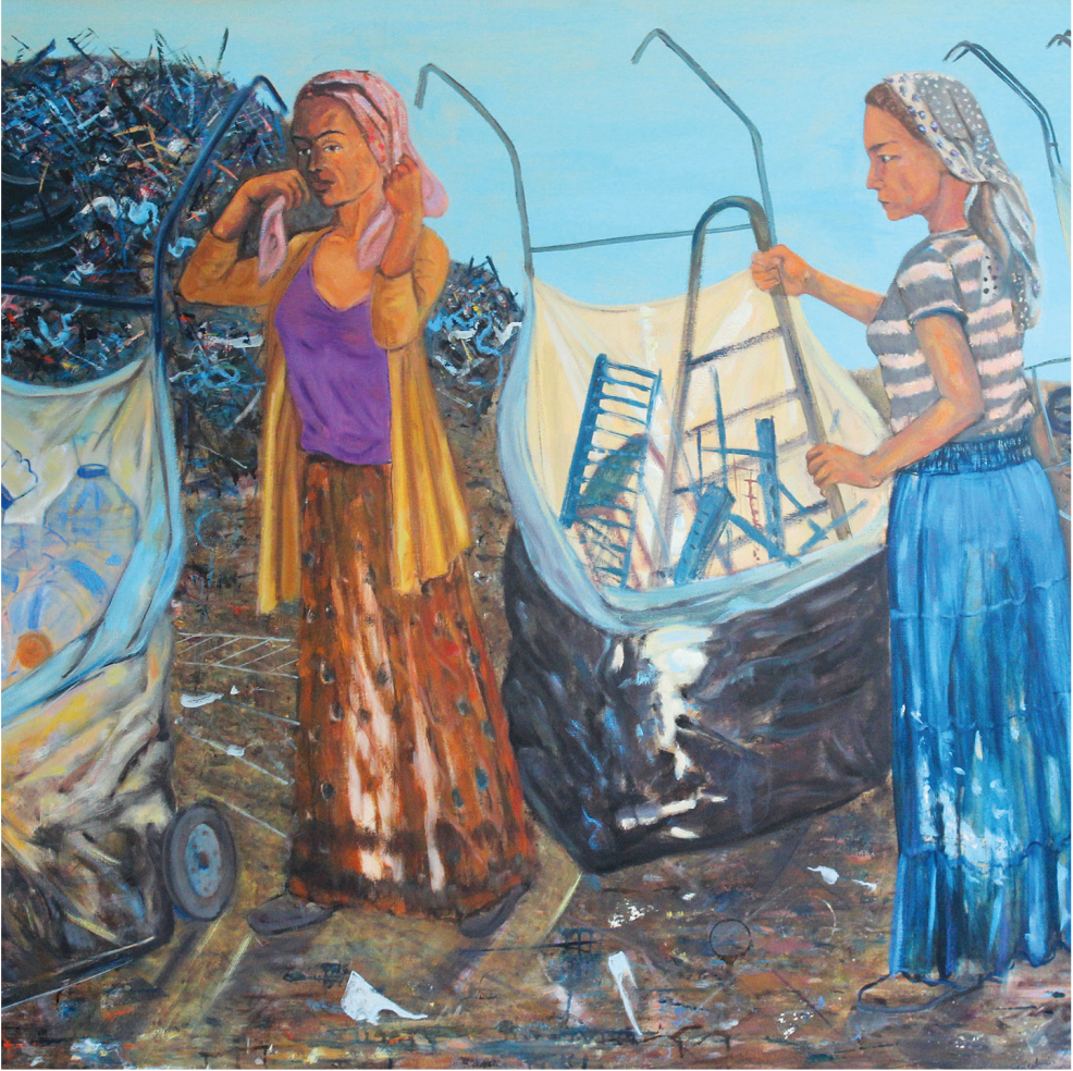
Resim: Erol BATIRBEK