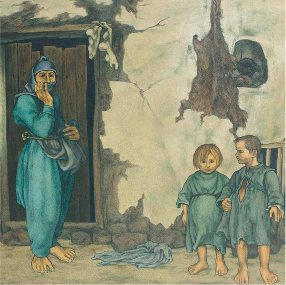
Resim: Neşet GÜNAL