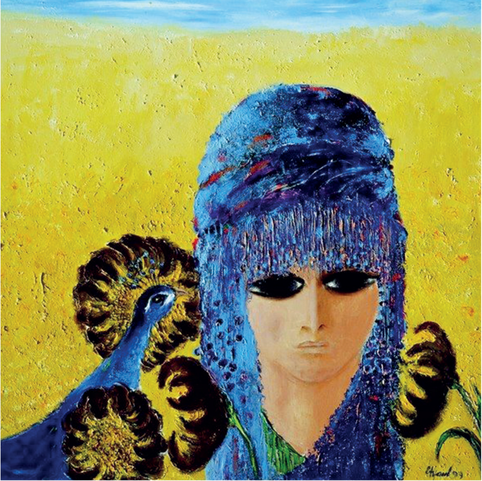
Resim: Fikret OTYAM