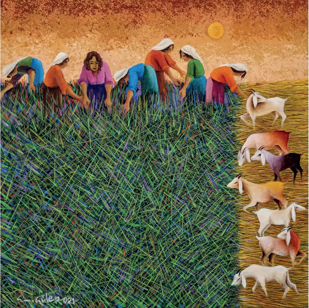
Resim: Emin GÜLER