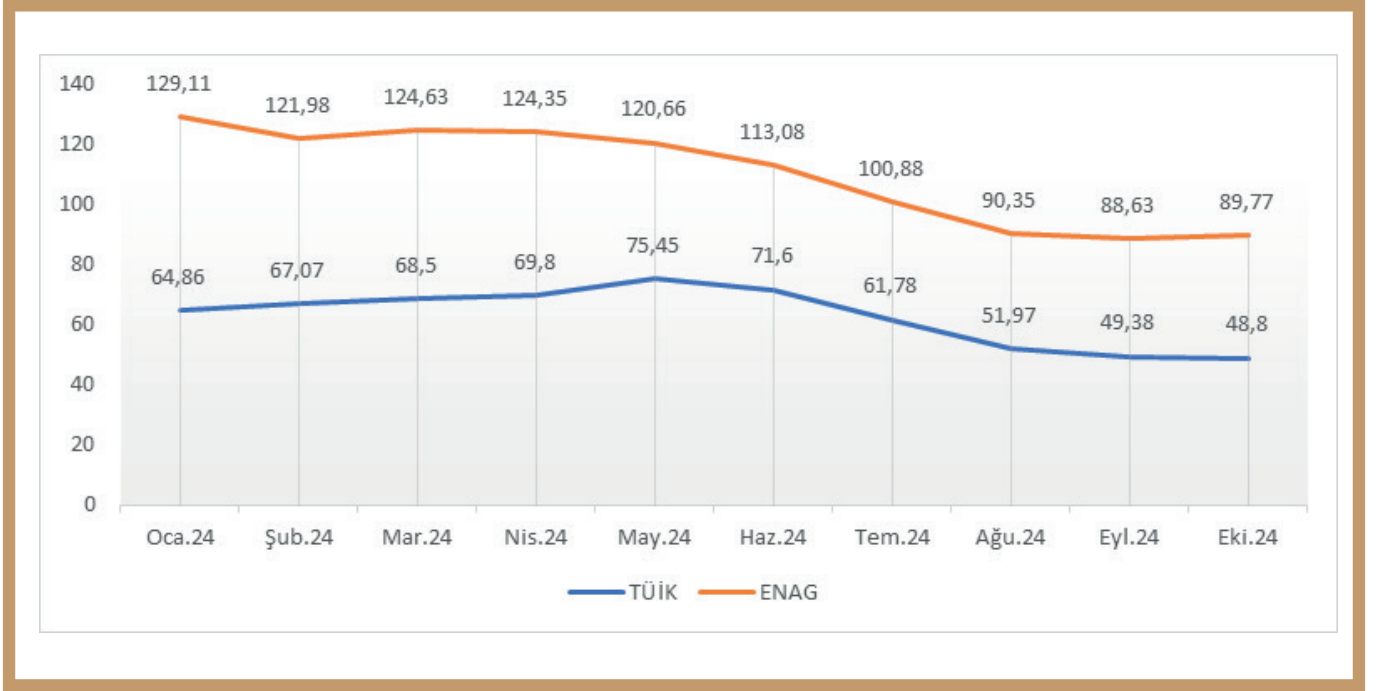
Grafik: TÜİK ve ENAG verilerine göre açıklanan enflasyon oranları