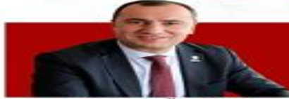
Kadem ÖZBAY Eğitim-İş Genel Başkanı